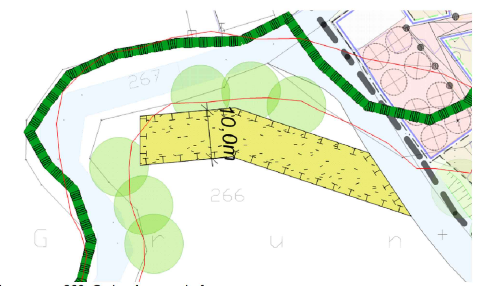
Flurnummer 266, Gmkg. Ammerndorf Nicht maßstäblich Darstellung, geordnet