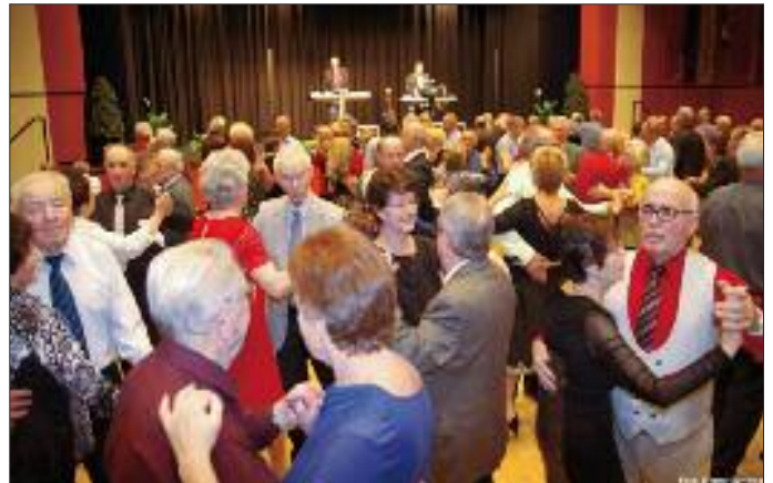
Volle Tanzfläche beim Seniorentanz-Ball 2019 in der Paul-Metz-Halle

ZIRNDORF - Das neue Jahr war erst sechs Tage alt – und schon stürmten die Senioren die Tanzfläche beim Zirndorfer Seniorentanz-Ball in der Paul-Metz-Halle.