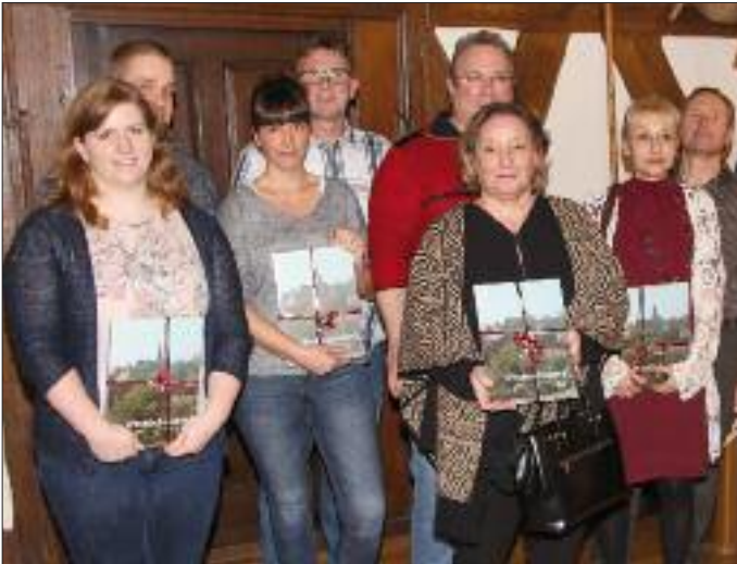
Neubürger wurden eingeladen

„Hadewartsdorf“ das erste Mal urkundlich erwähnt. Das ist nun 850 Jahre her und soll natürlich auch gebührend begangen werden. Dazu hat sich ein weiterer Arbeitskreis schon mehrfach getroffen und verschiedene Veranstaltungen ausgearbeitet die im Jahresverlauf stattfinden werden. Bereits am 17. März wird der Windsbacher Knabenchor ein Konzert in der evangelischen St. Walburgskirche geben. Am letzten Juniwochenende findet dann die zentrale Festveranstaltung statt mit vielen örtlichen Akteuren, Dorfrundgängen und zwei Abendveranstaltungen mit Livemusik, lassen Sie sich überraschen.