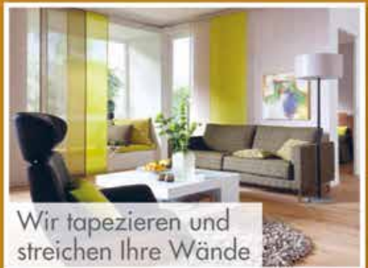
Wir tapezieren und streichen Ihre Wände

Sie erhalten von uns einen Gutschein über 50,- €