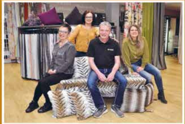
Wir verlegen Ihre Böden