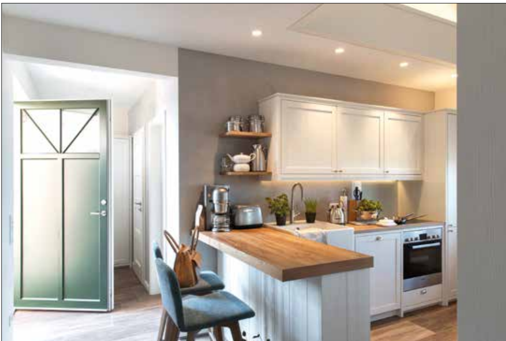
Gestalten statt nur streichen. Mit Schweizer Naturkalk Feinputz wird aus Farbe Design.

(pr-jaeger) Ob puristisch kühl, erdig warm oder himmlisch leicht – reine ökologische Naturkalkfarben und Naturkalkputze mit ihren sinnlich-haptischen Oberflächen und dem sanften