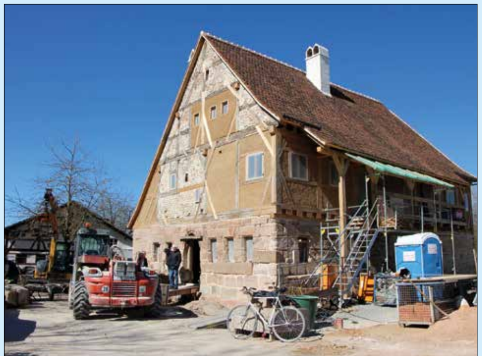
Das Fränkische Freilandmuseum baut zurzeit das mittelalterliche Badhaus aus Wendelstein wieder auf.