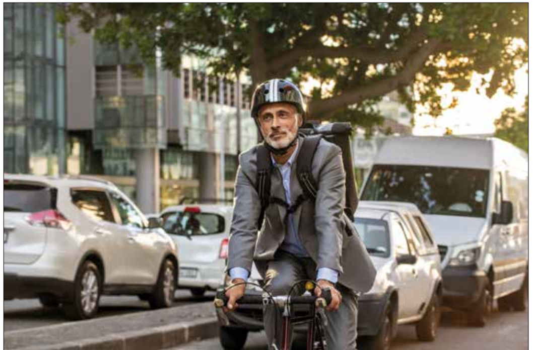
Wer auf dem Weg zur Arbeit das Fahrrad nutzt, fährt gesund und günstig.

Radfahren zählt zu den gesündesten Sportarten und lässt sich gut in den Alltag integrieren. Ziel der Radaktion ist, in der Zeit von Juni bis Ende September mindestens an 20 Arbeitstagen in die Firma oder vom Home-Office aus zu radeln. „Auch Pendler können sich an der Aktion beteiligen, da das Radeln bis zum Bahnhof oder Pendlerparkplatz bereits gewertet wird“, so Manfred Beuke. Rund 70.000 Menschen haben sich im vergangenen Jahr in Bay-