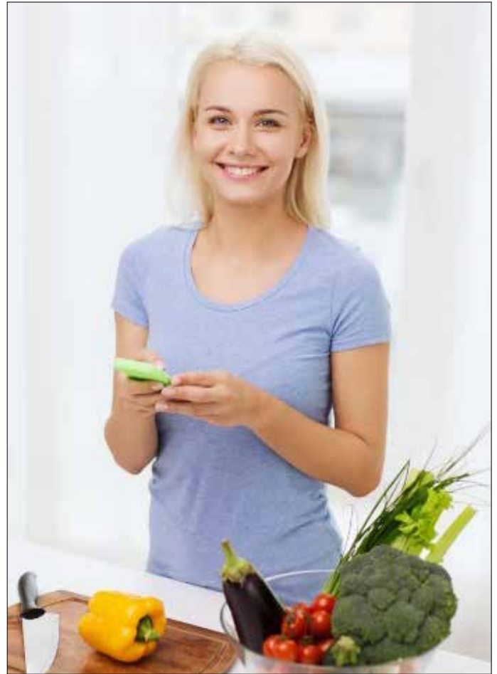
Die Online-Ernährungs-Beratung kommt jetzt per Smartphone direkt in die heimische Küche

Das neue Online-Angebot umfasst zusätzlich unter www.aok.de/bayern/oviva eine App-gestützte persönliche individuelle Ernährungsberatung für AOK-Versicherte. Außerdem gibt es drei verschiedene App-gestützte Online-Ernährungsprogramme. „Die Themen reichen von