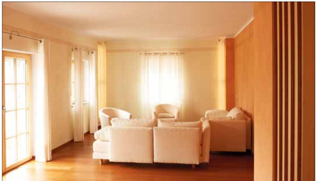
Schweizer Naturkalk ist eine Hommage an die italienische Wandgestaltungskunst von der Antike über die Renaissance bis zur heutigen Zeit.

Schweizer Naturkalk wird ganz anders produziert als Industriekalk. Biokalkfarben und Biokalkputze werden nach alter Schweizer Handwerkstradition aus Sumpfkalk hergestellt. Die Technik des "Sumpfsens" von