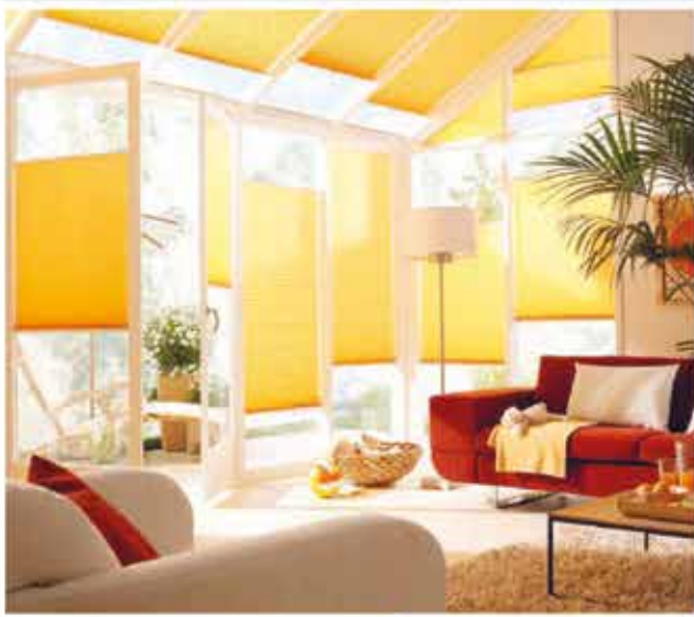
Wir kümmern uns um Ihren Sonnenschutz