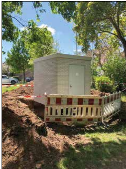
Ammerndorf, Dullikener Platz

Damit auch Ammerndorf und Großhabersdorf an das Glasfasernetz von Deutsche Glasfaser angeschlossen