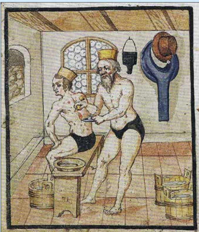
Schröpfszene in einer Badstube, Abbildung aus den Hausbüchern der Mendelschen Zwölfbrüderstiftung 1612, Stadtbibliothek Nürnberg