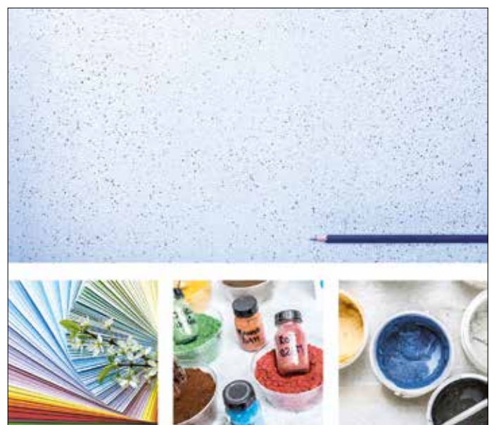
Über 200 Farbtöne, unzählige Zusätze und viele Oberflächentechniken ermöglichen eine enorme Gestaltungsvielfalt.